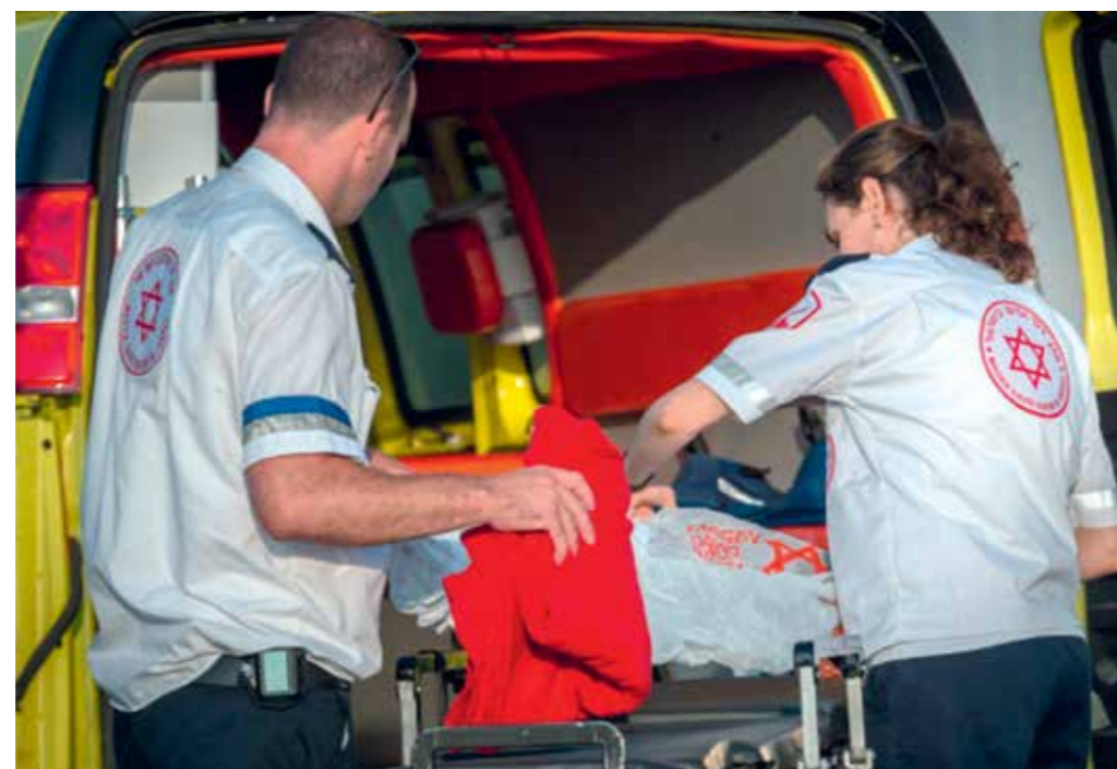
Cette ambulance donnée par les amis suisses sauve des vies dans la ville de Dimona.

Magen David Adom – Les Amis Suisses / Freunde in der Schweiz info@mda-schweiz.ch T +41 (0)76 802 63 69 CH-8000 Zürich Pour faire un don compte postal 80-39925-8