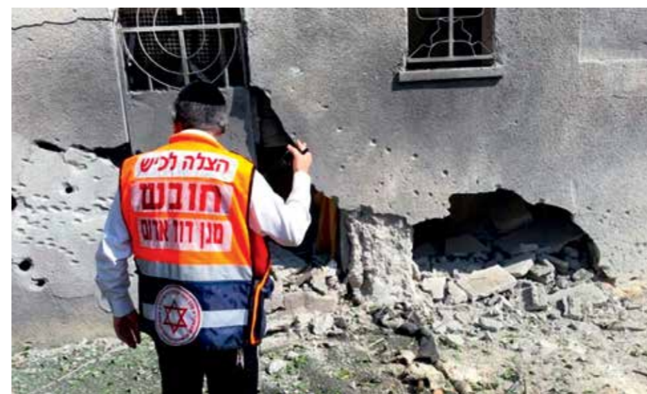
Les secouristes de MDA se trouvent toujours en première ligne. Un secouriste examine ici les dommages d'un bâtiment en Israël pendant l'opération «Bordure protectrice» de 2014.

Le MDA met en place des ambulances adaptées à toutes sortes d'urgences médicales, du centre mobile d'aide d'urgence pour les arrêts cardiaques ou les